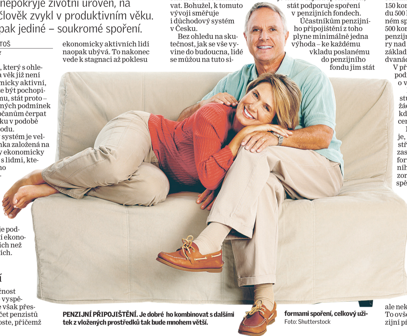
PENZIJNÍ PŘIPOJIŠTĚNÍ. Je dobré ho kombinovat s dalšími formami spoření, celkový užitek z vložených prostředků tak bude mnohem větší.

Na otázku, kolik investovat a do jakých produktů, vám odpoví odborně sestavený finanční plán, se kterým vám pomůže kvalifikovaný finanční poradce.